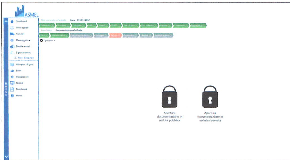
Schermata prima dell'apertura busta

Collegati alla piattaforma ASMECOMM, con le credenziali del RUP, sezione ALBO FORNITORI, abilita la stessa alla fase di verifica della documentazione tecnica contenuta nella busta telematica (virtuale) «TECNICA».