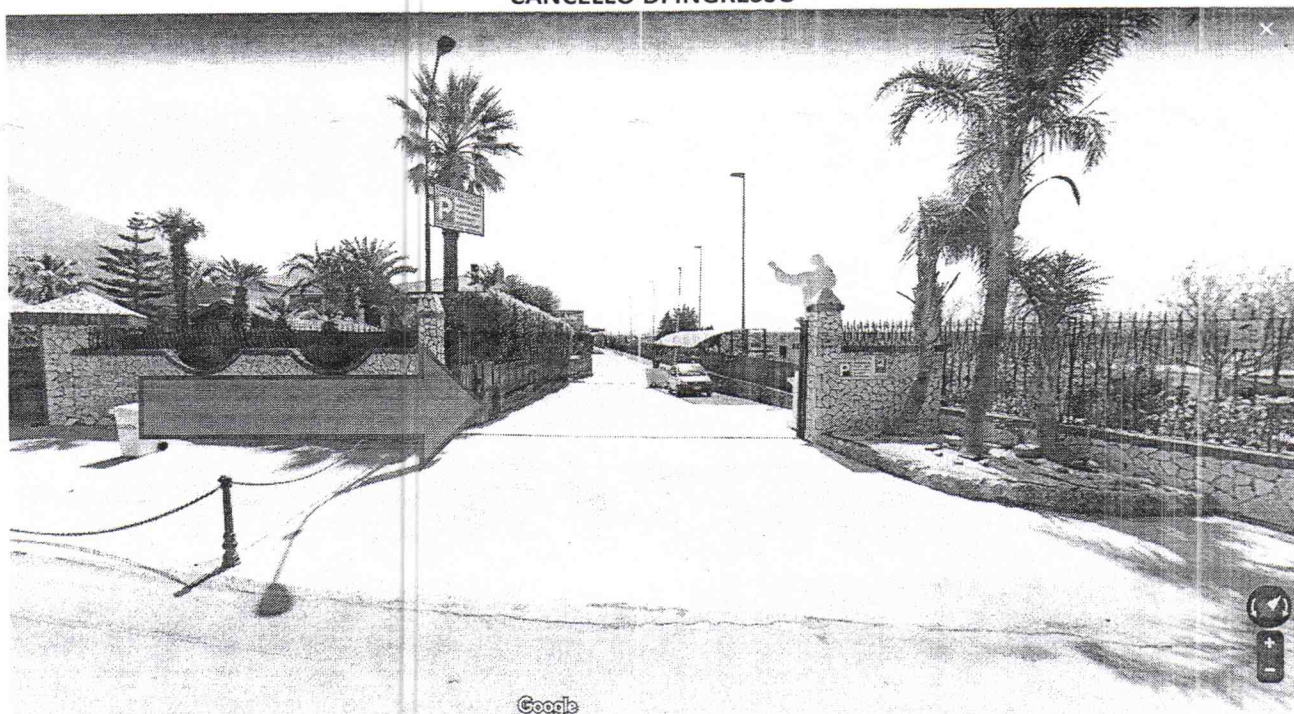
CANCELLO DI INGRESSO